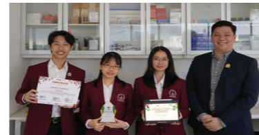
Gold Medal 2nd Runner Up ICoBioS x OBC, Inbio Indonesia.