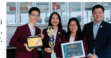
Juara 1 Kompetisi UBIQUINON 2023, Institut Pertanian Bogor.